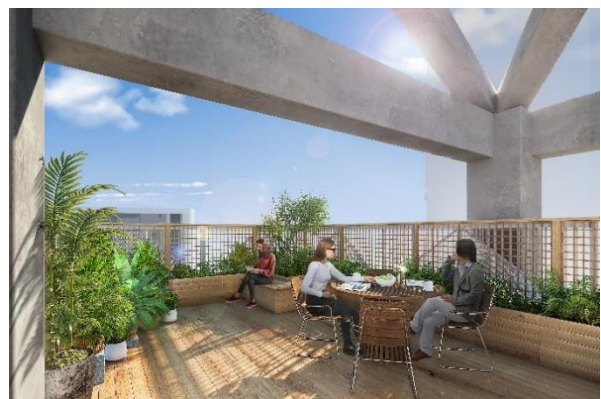
▲ルーフトップテナント入居イメージ

4階は最大天井高 5.6mの開放的な吹抜け空間となっており、約 45 m 2 の専用ルーフトップも完備され、自然を感じられる環境の中で、多様なワークスタイルに対応することが可能です。オフィスやショールーム、SOHO等の幅広い用途でご利用いただけます。