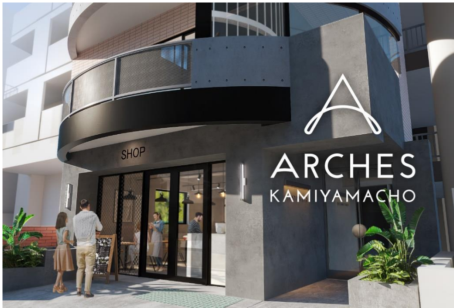
▲ARCHES KAMIYAMACHO 外観イメージ

■公式WEBサイト： https://ordermade-tokyo.jp/for-rent/arches/