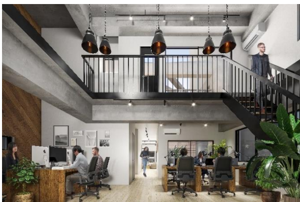
▲4階区画テナント入居イメージ