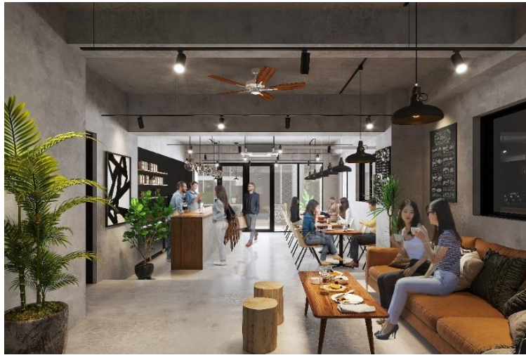
▲1階ショップ区画入居イメージ

人気の奥渋エリアで、路面に面した貴重な1階ショップ区画は、外からの視認性が高いガラス張りの開放的な空間で、カフェ・レストラン、バーやアパレルショップ等の利用はもちろん、ショールームとしてもご利用いただけます。